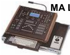
MA Lighting Scancommander [1 Stk.]

für alle Arten von DMX-gesteuerten beweglichen Scheinwerfern und Multifunktionslampen, bis zu 16 Geräte können angesteuert werden, inkl. Trackball und Pultleuchte, 5pol DMX Ausgang