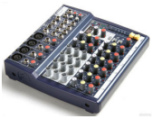
Soundcraft Notepad 124FX [2 Stk.] 4 Mic- / 4 Stereo-Kanäle, digital Effect Processor