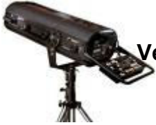
Verfolger Sagitter Tracer 2 [2 Stk.]

1200 HMI mit DMX, Abstrahlwinkel 10°-16°