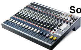
Soundcraft EFX12 [2 Stk.] 12 Mic- / 2 Stereo-Kanäle, 3 Band EQ, 1 Aux, 1 FX send 24bit digital Lexicon Effect Processor, 32 FX settings