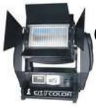
City Color Studio Due 2500 [4 Stk.]