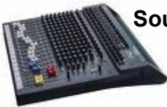
Soundcraft Spirit Folio SX [1 Stk.] 12 Mic- / 2 Stereo-Kanäle, 3 Band EQ, 3 Aux davon 1 pre/post 2 Sub, High Pass Filter