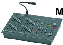
MA Lighting Lightcommander 12/2 [1 Stk.]

für alle Arten von DMX-gesteuerten beweglichen Scheinwerfern und Multifunktionslampen, bis zu 16 Geräte können angesteuert werden, inkl. Trackball und Pultleuchte, 5pol DMX Ausgang