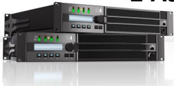
L-Acoustics LA4 [3 Stk.] 4 Kanal, 4 x 1000W / 4 Ohm