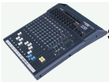
Soundcraft Spirit Folio F1 14 2 [2 Stk.] 6 Mic- / 2 Stereo-Kanäle, 3 Band EQ, 3 Aux davon 1 pre/post, High Pass Filter